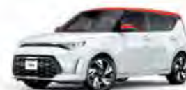
Clear White - Inferno Red