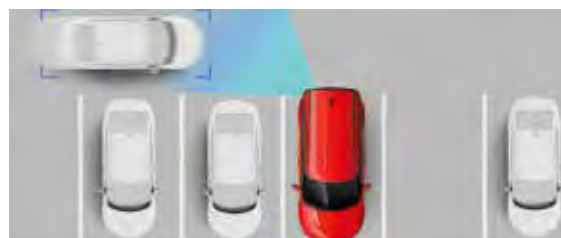
Asistencia para evitar colisiones de tráfico cruzado (RCCA)