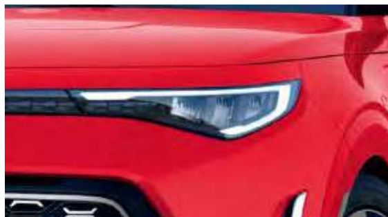
Faros full LED con luces diurnas*

La nueva Kia Soul además cuenta con una emocionante versión GT Line que incorpora un motor 2.0 L más poderoso y un diseño deportivo destacado por rines de 18" y un escape con salida dual. El interior no se queda atrás, con mood lamps que dan vida y color a tu música.