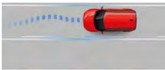
Control electrónico de estabilidad (ESC)