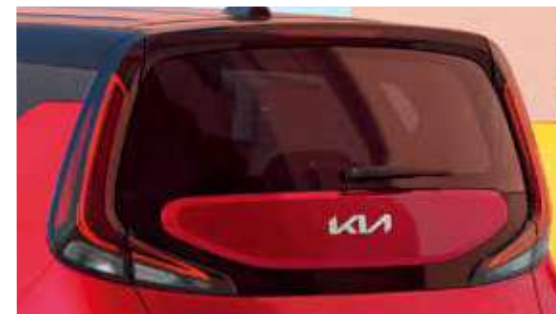
Faros traseros LED con faros de niebla*

En conjunto con el parachoques trasero, genera una perspectiva estable de la nueva Kia Soul .