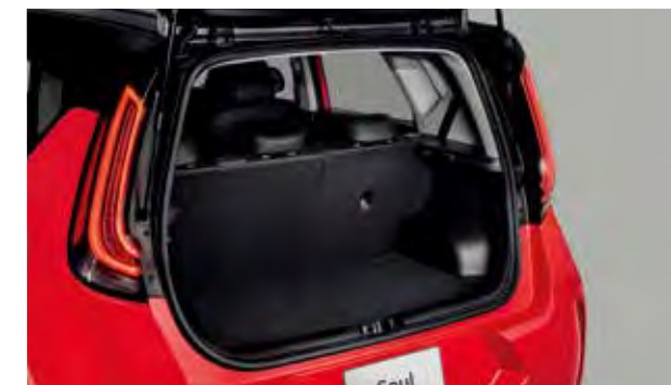
Cajuela con piso de dos niveles