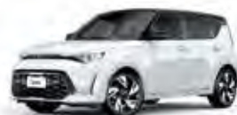
Clear White - Fusion Black