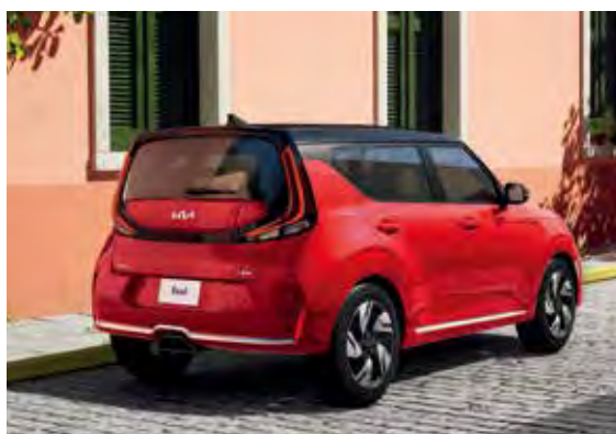
Sensores de estacionamiento traseros (PDW)