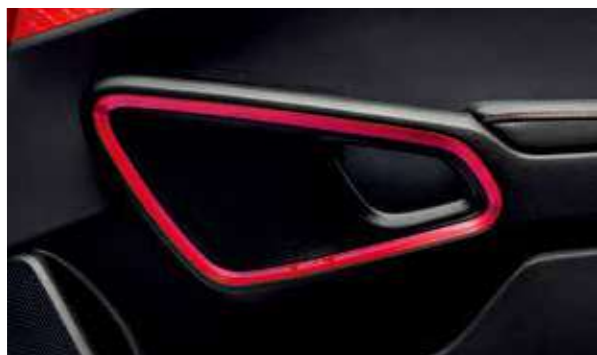
Luces ambientales en las puertas laterales con 6 modos de música y 8 tonalidades*