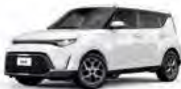
Snow White Pearl