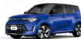
Neptune Blue - Fusion Black