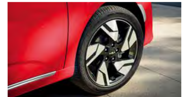
Rines de aluminio de 18"

Su diseño vertical se integra con las líneas de la cajuela, presentando un aspecto futurista más visible.