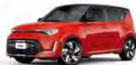
Inferno Red - Fusion Black