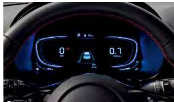
Clúster de instrumentos digital con pantalla LCD de 4.2"