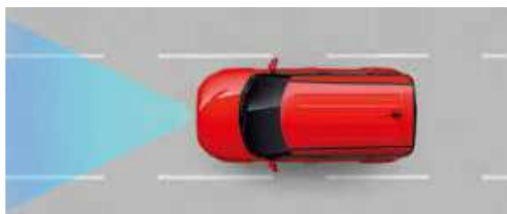
Sistema de mantenimiento de carril asistido (LKA)