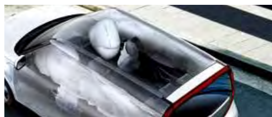
6 bolsas de aire: 2 bolsas frontales, 2 frontales laterales y 2 tipo cortina.

Además, todas las versiones de la nueva Kia Soul cuentan con 6 bolsas de aire, cámara de reversa con guías dinámicas (RVM), frenos ABS, control electrónico de estabilidad (ESC), sistema de asistencia de arranque en pendientes (HAC) y sistema de monitoreo de presión de llantas (TPMS).