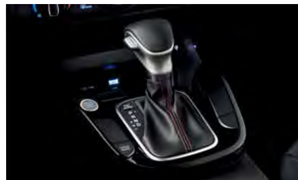
Palanca de velocidades con forro de piel*