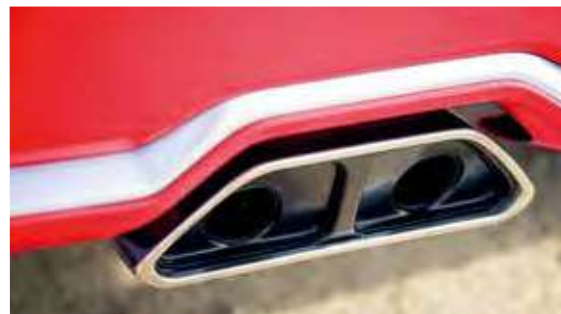
Escape con salida dual*

En conjunto con el parachoques trasero, genera una perspectiva estable de la nueva Kia Soul .