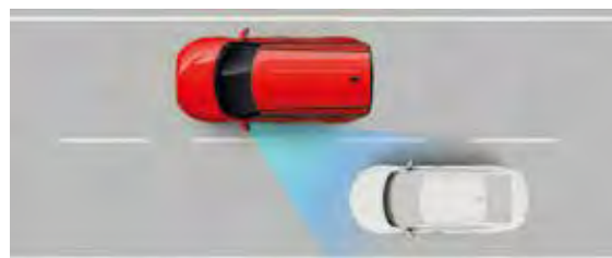
Sistema de evasión de colisión en punto ciego (BCA)