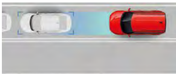
Sistema de evasión de colisión frontal (FCA)

La nueva Kia Soul no solo te hace ver bien. También incorpora numerosas características de seguridad ADAS que te protegen de forma inteligente.